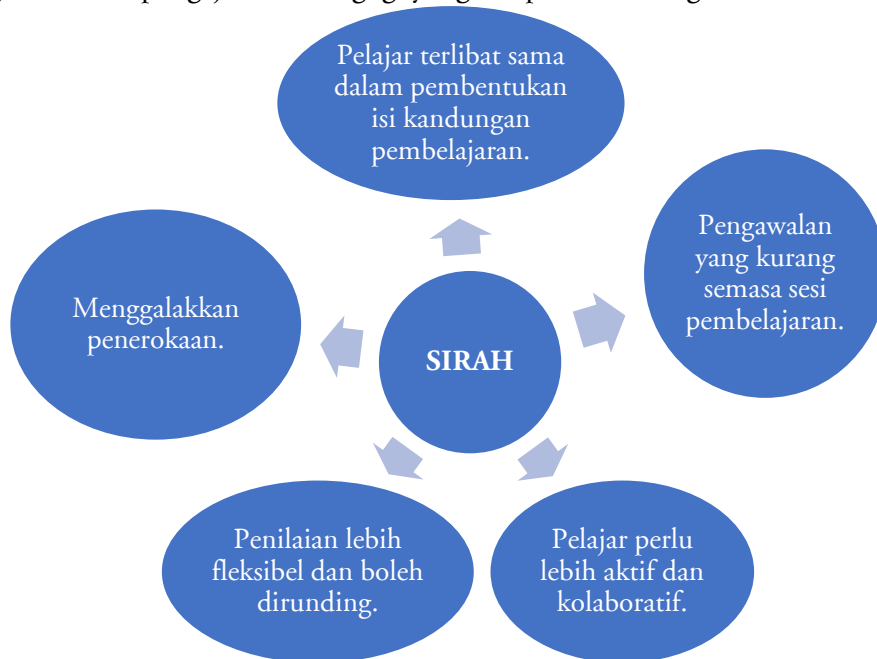
Rajah 2: Cara pengajaran heutagogi yang disepadukan dengan Pendidikan Sirah